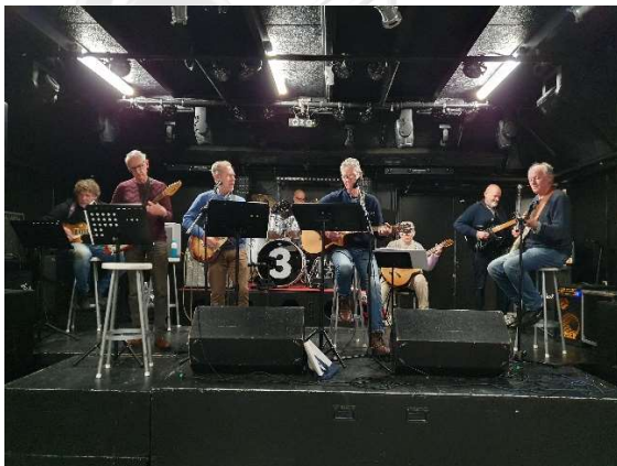
The Old stars