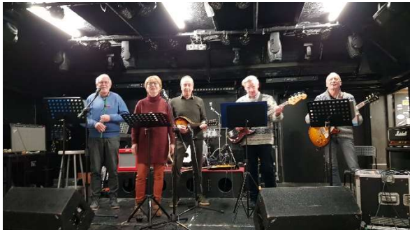
Goud van de Maandagmorgen